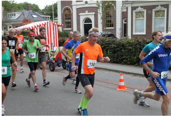
Net op pad.