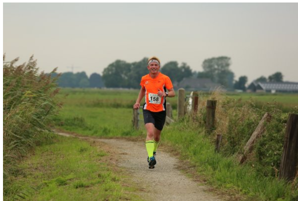
Op het schelpenpad.

Het verlossende bordje en Simon Blaauw staat langs de kant foto's te maken. Ik roep even naar hem dat ik op PR-schema lig.