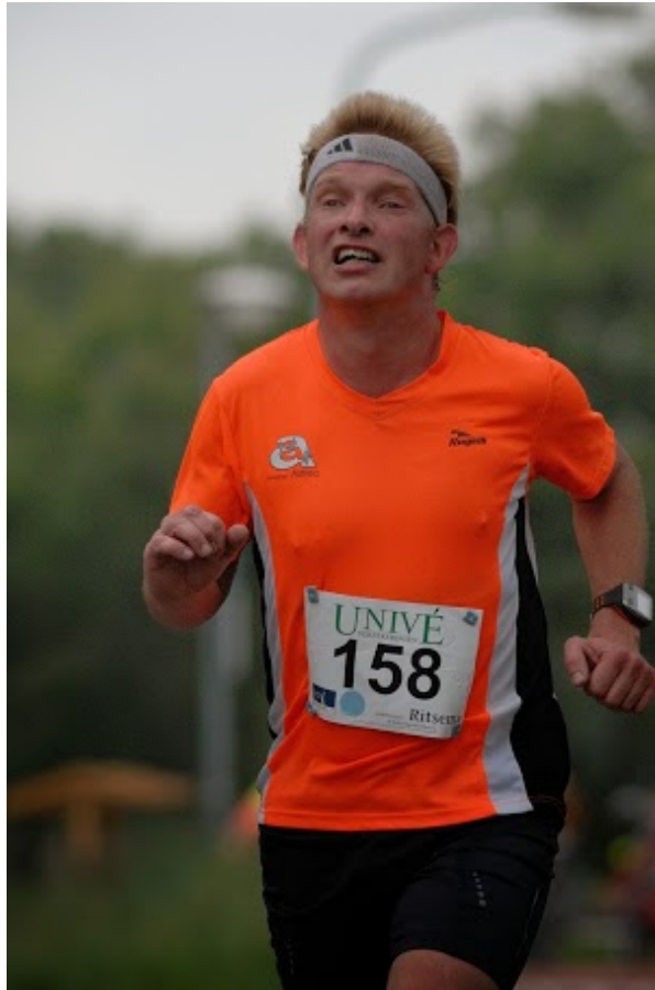
Na 12,5 kilometer.

Na 13 kilometer krijgen we het stuk met de wind in de rug. Voor me zie ik een loopster en dat is mijn volgende mikpunt. Langzaam kom ik dichterbij en ga haar voorbij. Even later haal ik ook een andere loper bij en is er weer een gat voor me naar 2 lopers die redelijk dicht bij elkaar lopen. Als ik nou het gat dichtloop kunnen we misschien met zijn drieën aan het stuk tegen de wind in beginnen en dan afwisselend kopwerk doen. Even voor het 18kilometerpunt haal ik ze bij, maar ze klampen helaas niet aan en zit er niets anders op dan alleen tegen de wind in te bikkelen. Een gat om dicht te lopen is er niet meer, althans die is er wel, maar is te groot. Vóór deze loper loopt Henk die toch weer verder uitloopt. Ik probeer te versnellen maar het